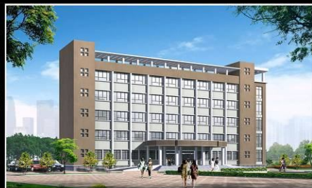
企業工廠、大樓小區