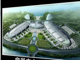
會展中心、體育館、影劇院